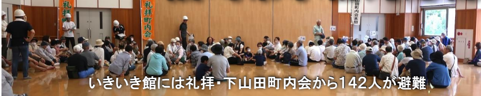
いきいき館には礼拝・下山田町内会から142人が避難