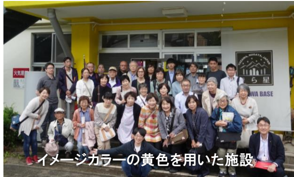
イメージカラーの黄色を用いた施設

午後に訪問した「湯沢学園」は、町内5つの保育園と5つの小学校を統合し、且つ、中学校を含めた「施設一体型保・小・中一貫教育システム」を導入、2014年に教育を開始しました。