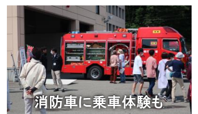
消防車に乗車体験も

6月18日(日)午前8時から、柏崎市が実施する水害に対応する防災訓練が西山町で初めて行われました。