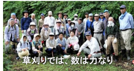
草刈りでは、数は力なり