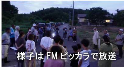
様子はFMピッカラで放送