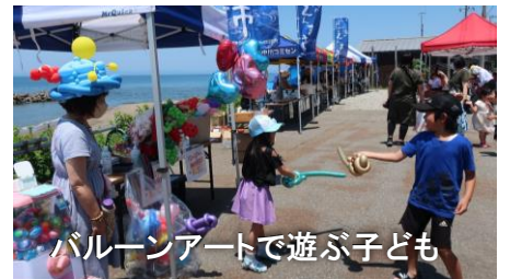
バルーンアートで遊ぶ子ども