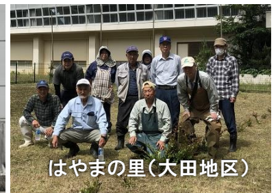
はやまの里（大田地区）