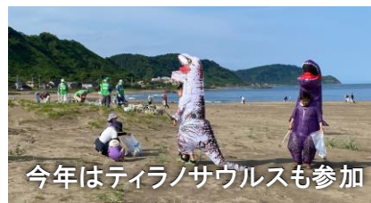
今年はティラノサウルスも参加