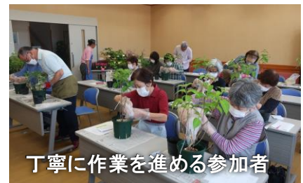
丁寧に作業を進める参加者

まず、ヤマアジサイの楽しみかたや、栽培と植え替え方法を学び、実際に植え替え作業を行いました。