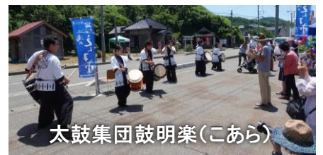
太鼓集団鼓明楽(こあら)