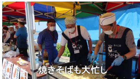
焼きそばも大忙し