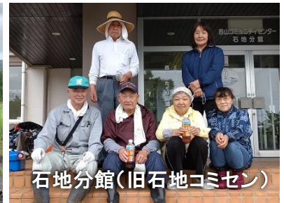
石地分館（旧石地コミセン）