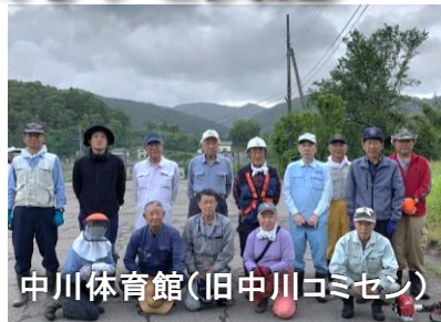
中川体育館（旧中川コミセン）