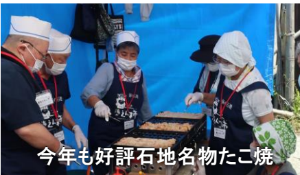
今年も好評石地名物たこ焼