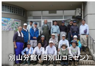
別山分館（旧別山コミセン）