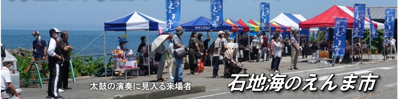
太鼓の演奏に見入る来場者