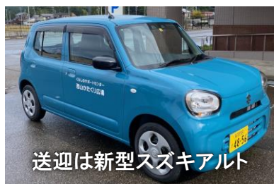
送迎は新型スズキアルト

11月7日から利用者の受け入れを開始しました。利用登録者は現在20人。11月は延べ71人の利用がありました。