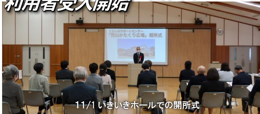
11/1 いきいきホールでの開所式