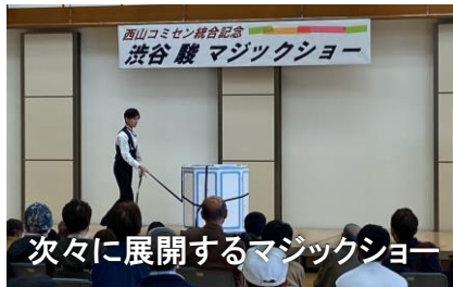
次々に展開するマジックショー