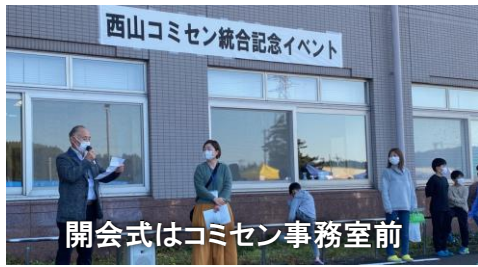
開会式はコミセン事務室前