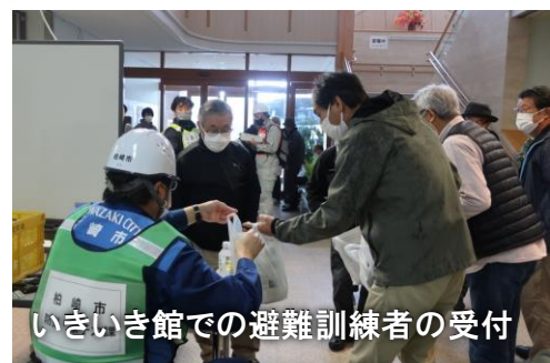
いきいき館での避難訓練者の受付

10月29日(土)午前8時から、柏崎刈羽原子力発電所の事故を想定した新潟県による防災訓練が行われました。西山コミセンでは、県の訓練に加えて住民全員参加の自主防災訓練を実施し、災害への備えを確認しました。また、村上市への避難訓練には大型バス4台に77人、自家用車10台に30人が参加。スクリーニング会場(豊栄SA)での簡易除染訓練、避難経路所(パルパーク神林)及び避難所(神林農村環境改善センター)での避難者受入訓練等の体験を通じ、避難行動の流れを確認しました。