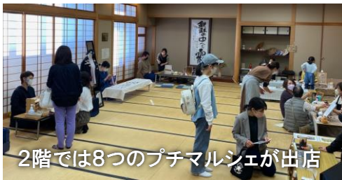
2階では8つのプチマルシェが出店