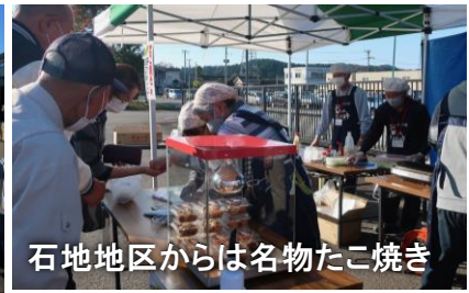
石地地区からは名物たこ焼き