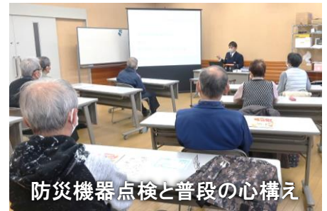
防災機器点検と普段の心構え

講話の後、通報訓練として、参加者の1人が手持ちのスマホから119番への通報を行いました。緊張しながらも聞かれたことに答えることができ、無事に講座を終了しました。