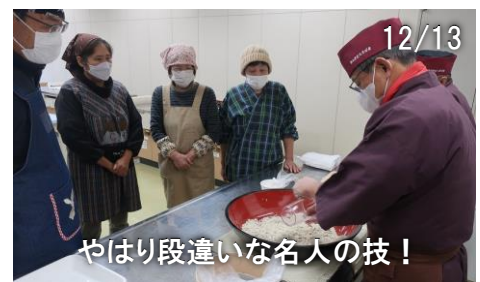
やはり段違いな名人の技！

まず、講師の方に見本を見せてもらい、その後教えて頂きながらそば打ちをしました。参加者の皆さんは、講師のそばの出来上がりを目指しながら挑戦し、各自満足のいくそばをお持ち帰りいただきました。