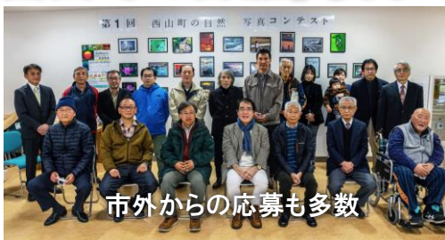
市外からの応募も多数

西山町の自然の魅力を外に発信するための写真コンテストが、西山自然体験交流施設ゆうぎの指定管理者㈱アール・ケー・イーの支援を受けて実施されました。