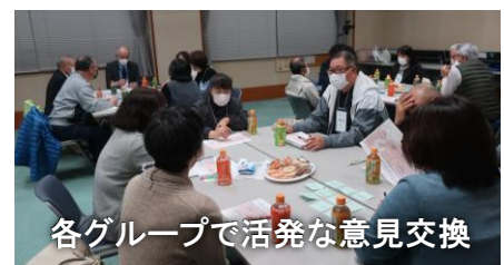
各グループで活発な意見交換

参加者は、地域の現状や強みと弱み、困っていることやコミセンに欲しい機能など、日頃から思っていることを自由に話し合いました。