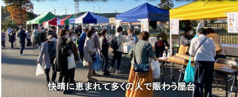
快晴に恵まれて多くの人で賑わう屋台

11月12日(土)午後1時30分から、4コミセンの統合を記念したイベントが開催され、来場者は280人を数えました。