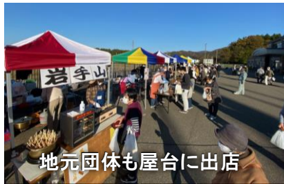
地元団体も屋台に出店