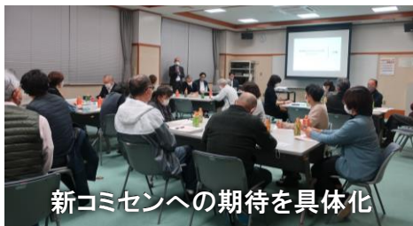
新コミセンへの期待を具体化

コミュニティ計画とは、地域の現状を分析しながら5年から10年先までを見据えた目標や課題を明らかにし、地域の未来像に対する具体的な行動計画を策定したものです。