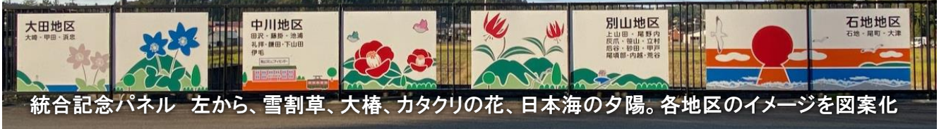
統合記念パネル 左から、雪割草、大椿、カタクリの花、日本海の夕陽。各地区のイメージを図案化