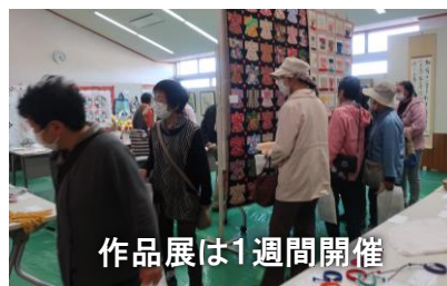
作品展は1週間開催