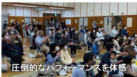
圧倒的なパフォーマンスを体感