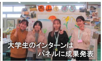
大学生のインターンは パネルに成果発表