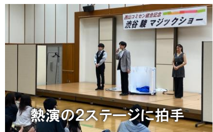
熱演の2ステージに拍手