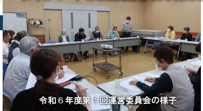
令和6年度第1回運営委員会の様子

付随事業 ：基本的な介護予防活動に加えて、地域ボランティアの協力を得ながら、くらサポ利用者に限定した「買い物送迎」「話相手」「レクリエーション指導」等や生活援助員の補助的な作業を行います。