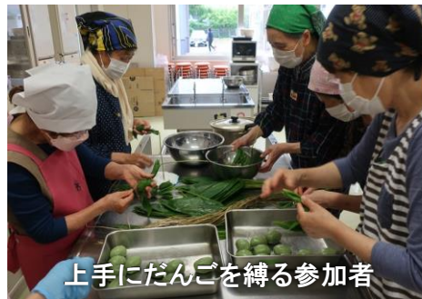
上手にだんごを縛る参加者

「親が作るのを見てたけど、まさか自分が作るとは」「出来るかどうか心配だったが、丁寧に教えてもらって作ることが出来た」などの声がありました。出来たてを試食し、各人5個を持ち帰りました。