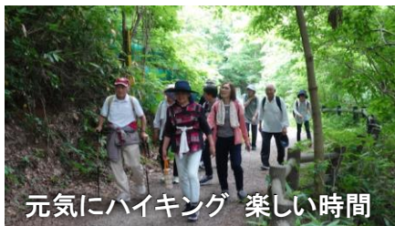
元気にハイキング 楽しい時間

曇りで心地よい風も感じられ、アジサイも綺麗で、気持ちよいハイキングとなりました。