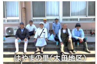
はやまの里（大田地区）