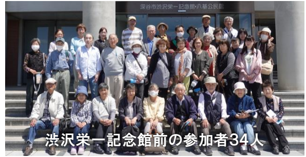
渋沢栄一記念館前の参加者34人