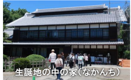
生誕地の中の家（なかんち）