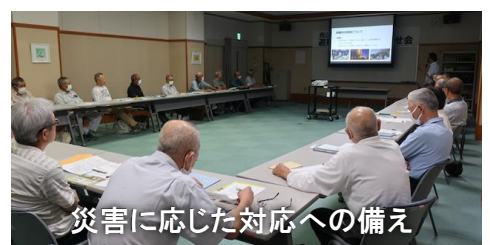
災害に応じた対応への備え