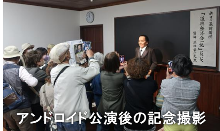
アンドロイド公演後の記念撮影