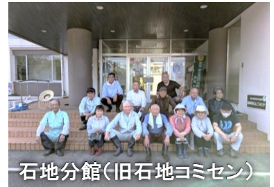
石地分館（旧石地コミセン）