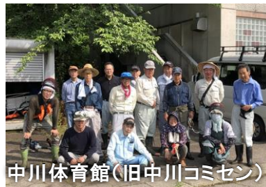
中川体育館（旧中川コミセン）