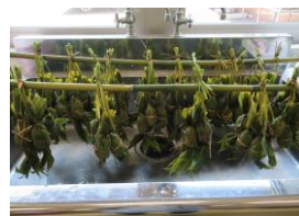
茹でたら 干して 出来上がり