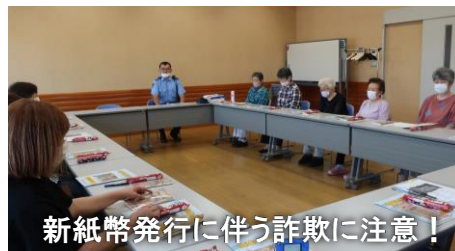
新紙幣発行に伴う詐欺に注意!

今年1回目の知っ得講座は、「犯罪から身を守るために」というテーマでお話をお聞きしました。実際に柏崎市であった4,500万円を振り込んでしまった特殊詐欺の手口は巧妙で「もしかしたら自分も…」と考えさせられる事例など、詐欺に合わないための注意点をお聞きし、有意義な時間となりました。