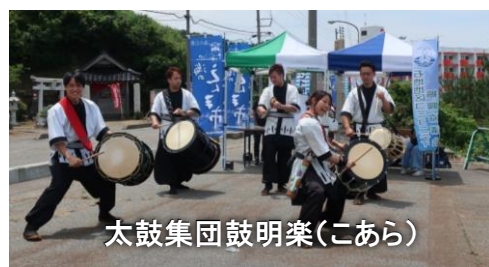
太鼓集団鼓明楽(こあら)