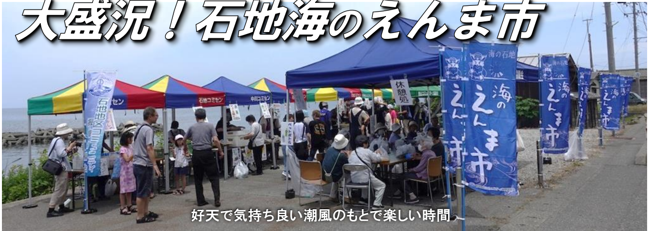
好天で気持ち良い潮風のもとで楽しい時間