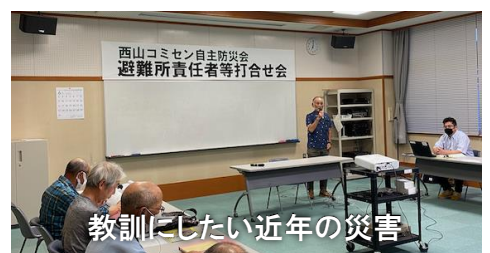
教訓にしたい近年の災害

7月21日(日)には防災訓練の第2部として、いきいき館、中川体育館、石地分館、別山分館及び西山総合体育館の各地区担当者が集合します。