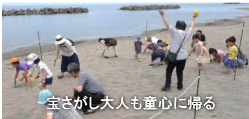
宝さがし大人も童心に帰る