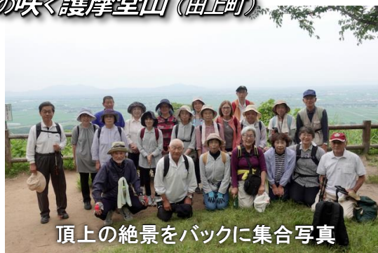
頂上の絶景をバックに集合写真