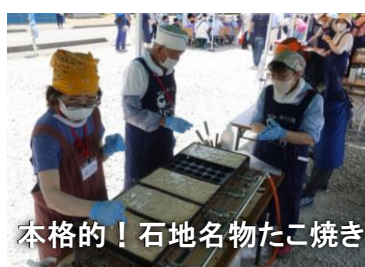
本格的！石地名物たこ焼き