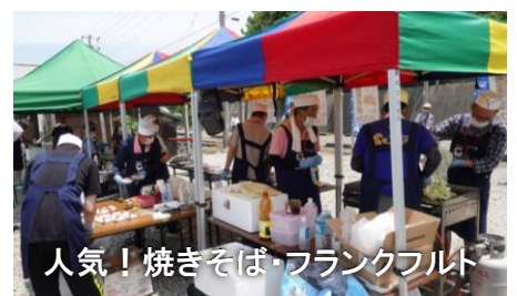
人気！焼きそば・フランクフルト

6月22日(土)午前11時から、今年で15回目となる「石地海のえんま市」が開催され、好天に恵まれ多くの方が来場されました。