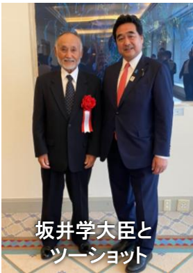
坂井学大臣と ツーショット