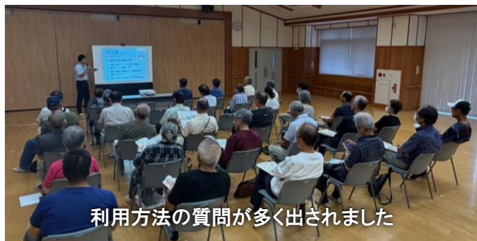
利用方法の質問が多く出されました